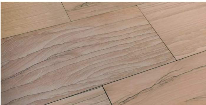
Sandstone, lieferbar in 80x40x2 u. 120x60x2 cm