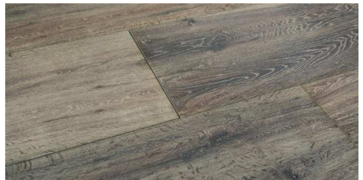
Oak, lieferbar in 80x40x2 cm