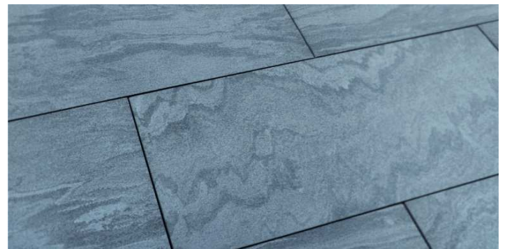
Nightfire, lieferbar in 80x40x2 cm