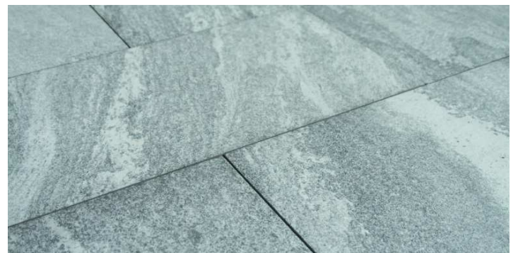
Vivace, lieferbar in 80x40x2 u. 120x60x2 cm

Die Verlegung dieser Platten gestaltet sich einfach und kann entweder auf Splittbett, Einkornmörtel, Stelzlager oder im Kleberbett erfolgen.