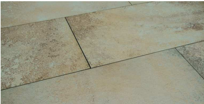
Solnhofen, lieferbar in 80x40x2 u. 120x60x2 cm