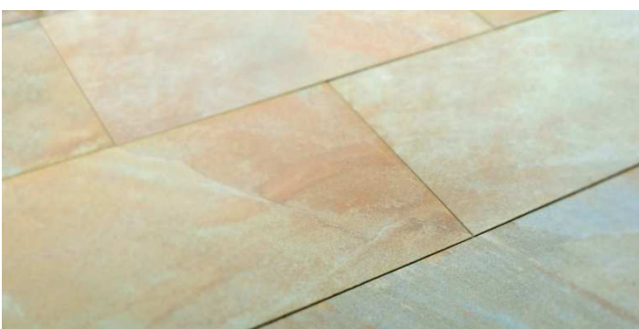
Limerick, lieferbar in 80x40x2 cm